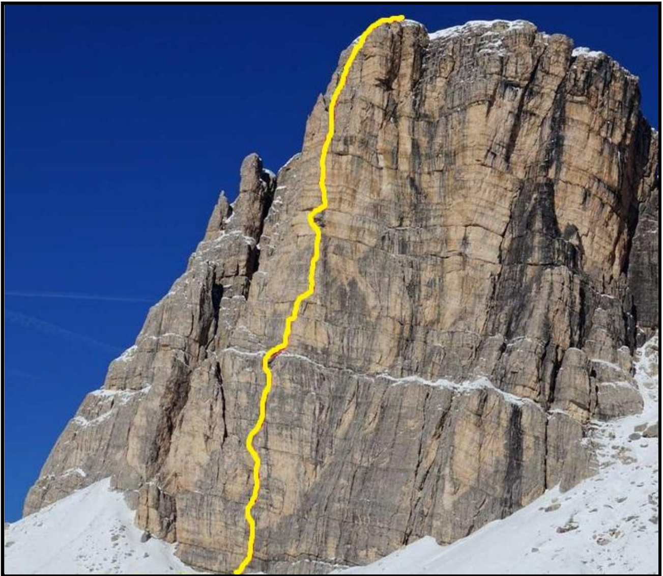
In GIALLO il tracciato della via